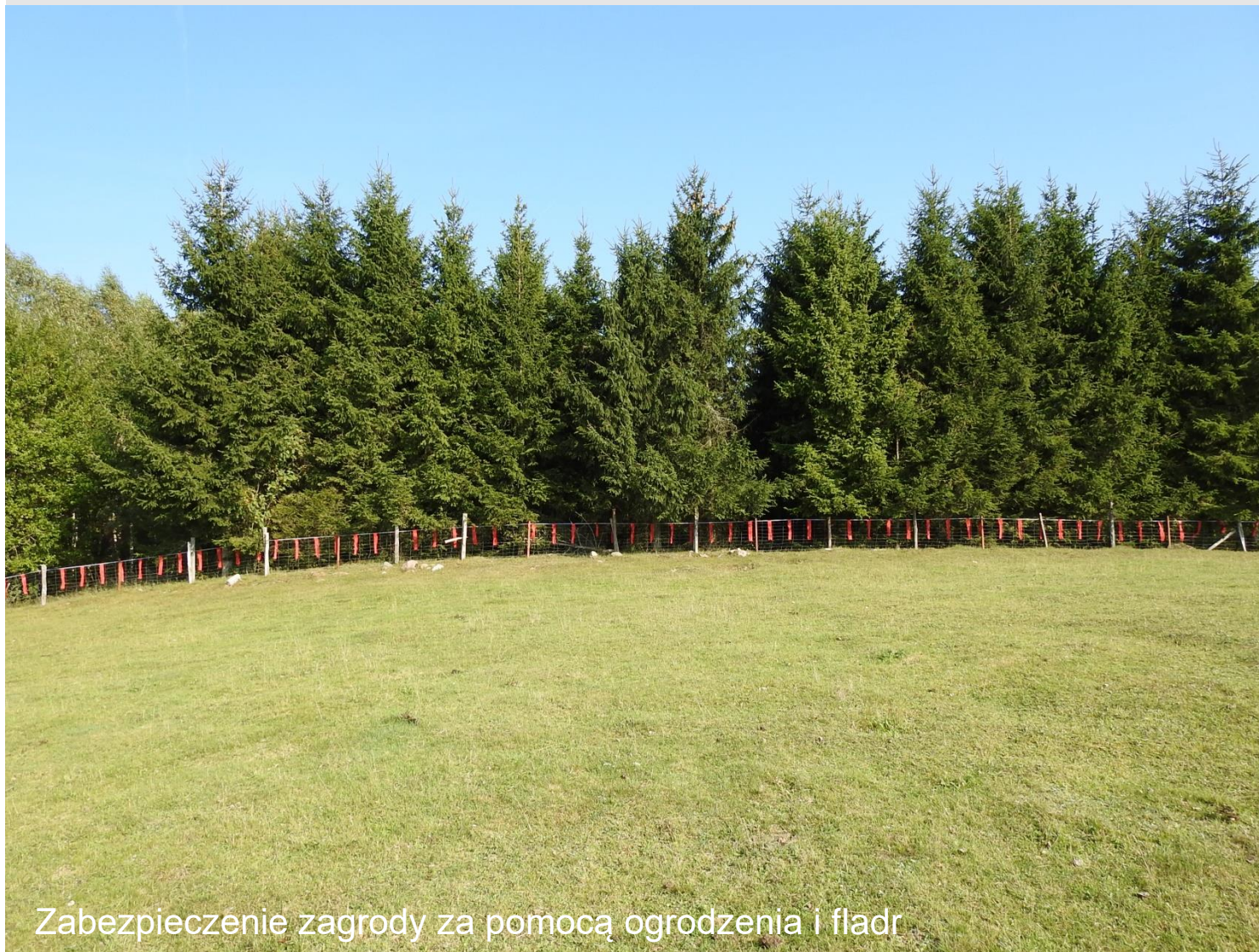
Zabezpieczenie zagrody za pomocą ogrodzenia i fladr