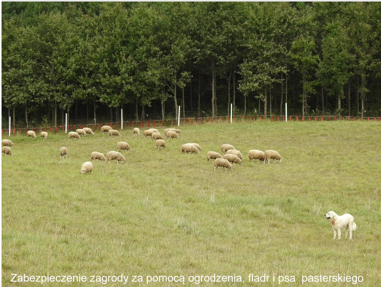
Zabezpieczenie zagrody za pomocą ogrodzenia, fladr i psa pasterskiego