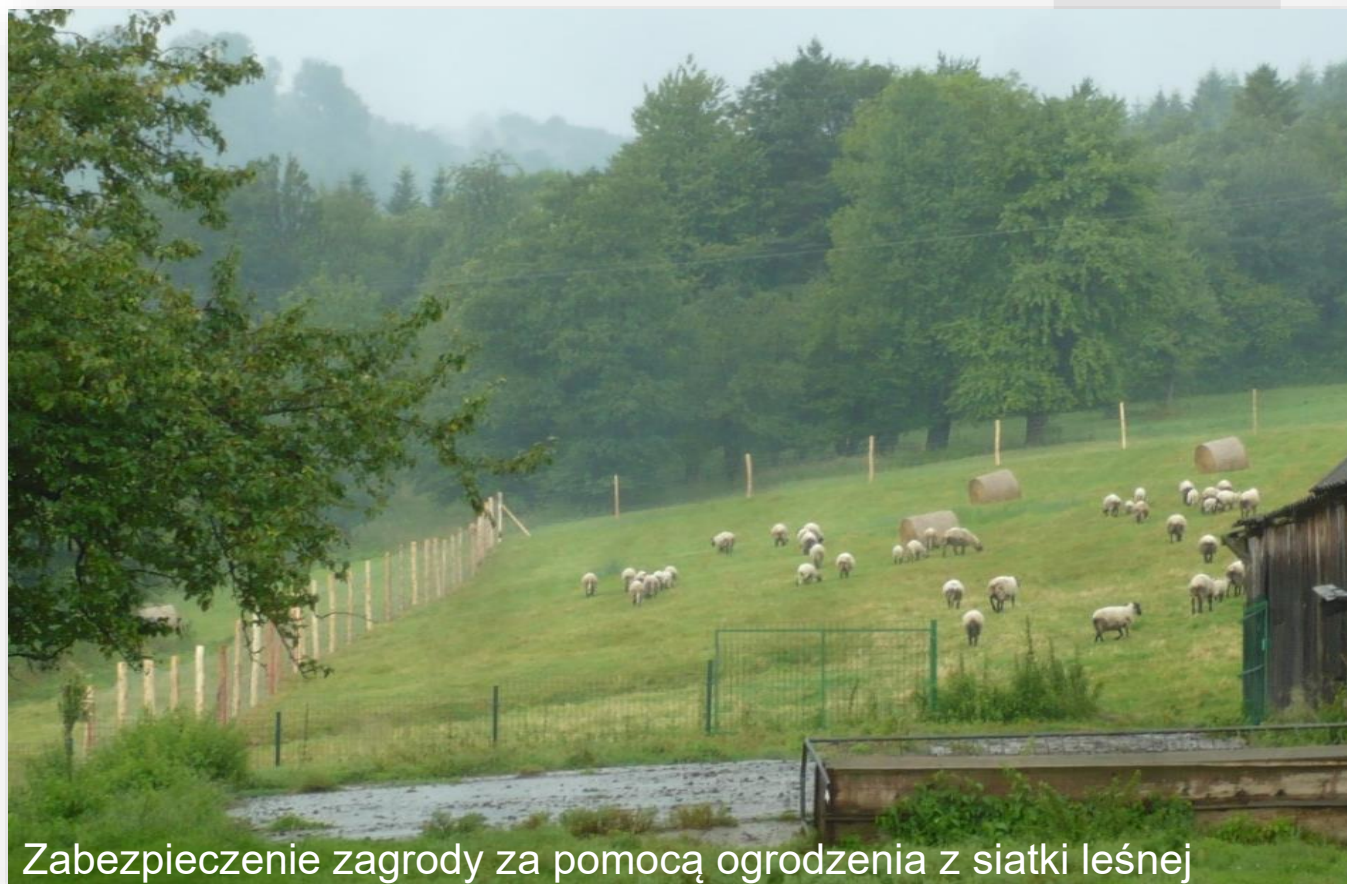
Zabezpieczenie zagrody za pomocą ogrodzenia z siatki leśnej