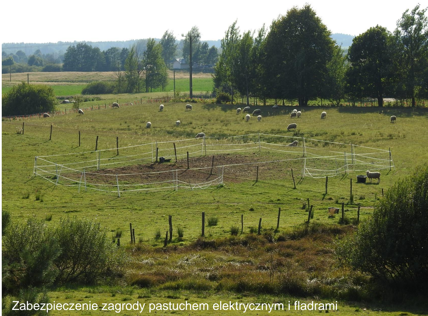
Zabezpieczenie zagrody pastuchem elektrycznym i fladrami