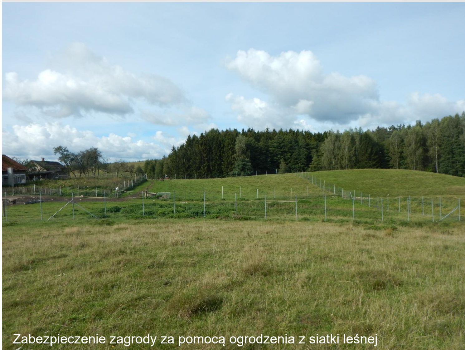
Zabezpieczenie zagrody za pomocą ogrodzenia z siatki leśnej