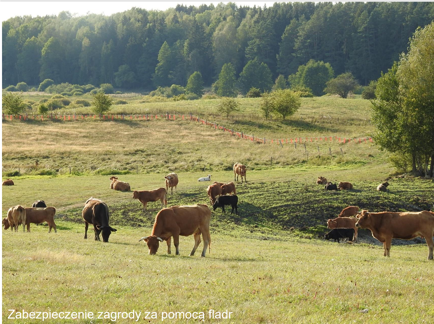
Zabezpieczenie zagrody za pomocą fladr